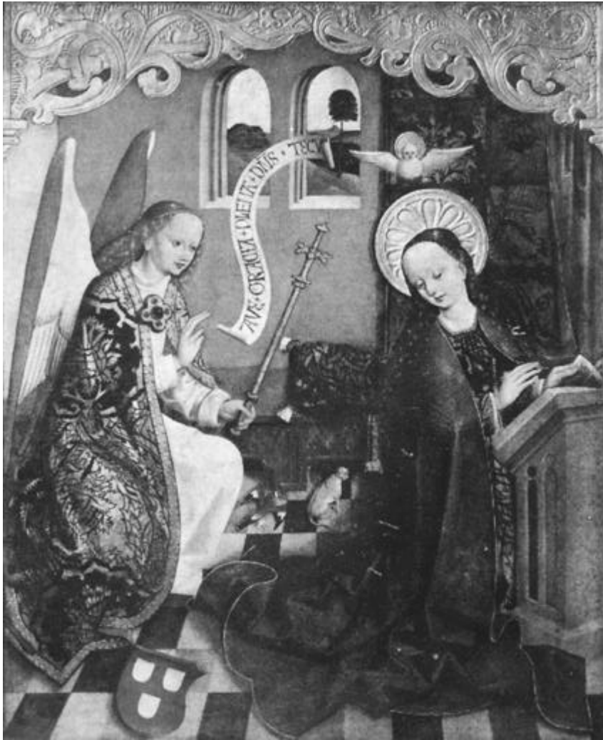
Abb. 2: Verkündigung, Fragment eines Epitaphs, Ende 15. Jahrhundert. Warschau, Nationalmuseum. Aus: Dobrzeńiecki, Catalogue 290.